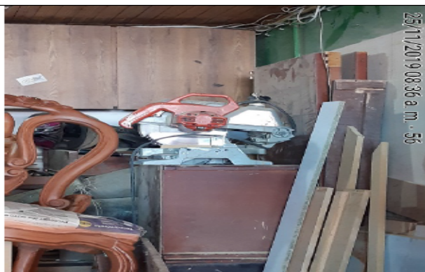
Fotografía No 4. Sierra.