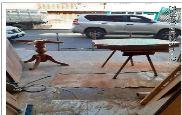
Fotografía No 5. Área de pintura.