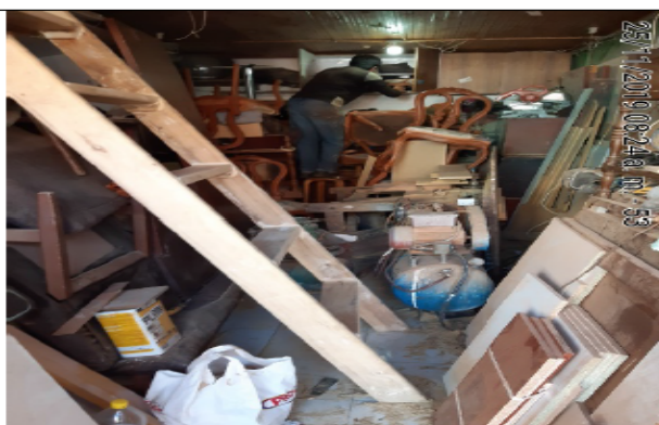
Fotografía No 5. Área general de trabajo.