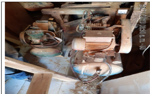
Fotografía No 3. Compresor.